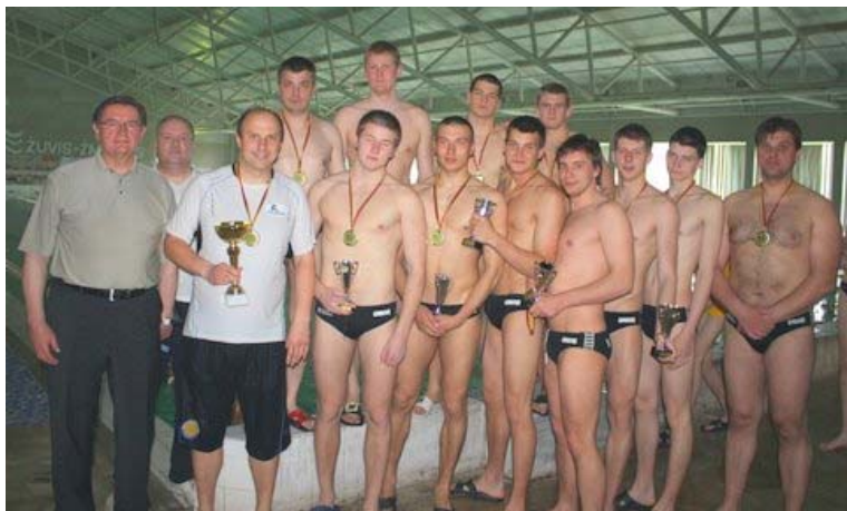
2010 metų Lietuvos vandensvydžio čempionai - Vilniaus "VSM-Baltic-Amadeus"

Nedidelis taškų skirtumas tarp dviejų lyderių leido manyti, kad čempionato intriga dar neišsisprendė. Juk užtektų alytiškiams antrajame ture įveikti vilniečius – tai jau ne kartą buvo – ir visos prognozės vėl galėjo apsisversti.