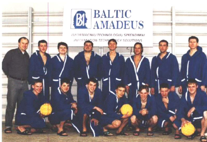
2002 m. Lietuvos čempionai - Vilniaus „VSM-Baltic-Amadeus“

Deja, nesklandumų būta ir kovo 20 d. įvykusiose rungtynėse tarp Kauno „Dainavos“ ir Vilniaus „Delfino“. Jų rezultatas buvo anuliuotas, nes buvo pažeisti varžybų nuostatai. „Dainavos“ komandoje žaidė vandensvydininkai, kurie nebuvo užregistruoti paraiškoje. Jas peržaidus, laimėjo Vilniaus „Delfinas“ – 7:4. Dabar trečiosios vietos likimą turėjo nuspręsti „Delfino“ ir „Jūros liūtų“ rungtynės. Jos pasibaigė klaipėdiškių pergale – 17:8.