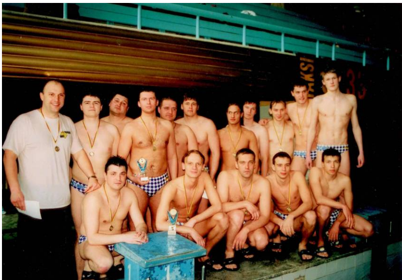
2003 metų Lietuvos čempionai - Vilniaus "Baltic-Amadeus" komanda